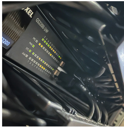
Wartung und Überwachung von Netzwerken