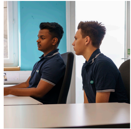
Kundenberatung und Projektarbeit

Bei uns entwickelst du unterschiedliche fachliche Schwerpunkte. Du bist in der Lage Kunden/innen bei Problemen zu unterstützen, nimmst neue Geräte in Betrieb, installierst und konfigurierst Server und betreust Netzwerke. Zudem durchleuchtest du Probleme und erstellst Lösungsvorschläge, stellst PC-Arbeitsplätze bereit indem du Hardware und Software installierst und sorgst für sicheren Datenverkehr.